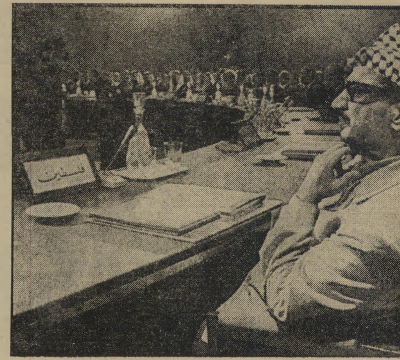
עראפאת ליד שרט, "פסמטון" ברבאט היינו שם

במשך השנים קשר העולם הזה, ובייחוד אורי אבנרי, קשרים אמיצים מאוד עם חברי הקבוצה הבינלאומית המצומצמת, המסקלת את אירועי העולם הערבי למען העיתון נים החשובים ביותר בעולם. קשרים אלה התהדקו בוועידות בינלאומיות (ועידות פירנצה, ועידת בולוניה, ועידת ז'נבה) שבהן השתתף אבנרי או כמשקיף, בפני שות פרטיות במקומות רבים בעולם, ובעת ביקוריהם של עיתונאים זרים אלה בישראל. מה שהתחיל כהיכרות תוך עבודה משותפת הפך, במקרים רבים, לשיתוף-פעולה החורג בהרבה מעבר לתחום הצר של עבודתה עיתונאית. חברי הקבוצה הבלתי-רשמית