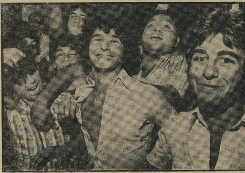
ברם ואש הצדק יקום אנחנו נראה להם

המחיר היה יקר. המישטרה דרשה מהנהלת קבוצת בני יהודה להכשיר בי מיגרש 7000 מקומות ישיבה מסומנים. הרי קבוצה אינה מסוגלת לעמוד בכך, כי לצורך זה היא זקוקה לסך של 400 אלף לירות. העירייה השיבה ריקם את בקשות