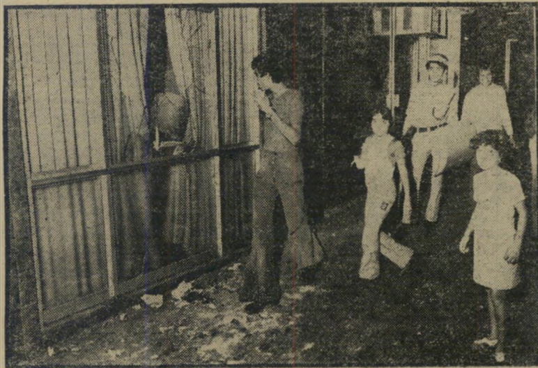
פחיוכר לתוך הכנף נקמה במיחמד המקפח

מסקנה זו, שאליה הגיעו חברי הוועדה, היא המקשרת מחדש את אירועי השבת האחרונה בשכונת התיקוה עם מחדלי אנשי התאחדות לכדורגל, אשר אינם נשמעים ל"צילצולי הפעמון" של ועדת-עציוני, וממשיכים להתכחש להם ולהתעלם מכל הבעיות הכרוכות בהפעלה סדירה של מישחקי-הכדורגל בארץ.