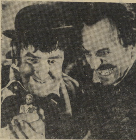
חטפתי חאזוק של סיירת "הידוק", הן, איזה חיבוק! לא נשאר לי אף שלוק.

שיר זה נשמע השבוע מפיו של אזרח סוטה, שנחפש במארב של סיירת "הידוק החגורה" (ראה תמונה). נראה שהאיש השמן ונוסף-המותרות עורר את חשדנותם של אנשי הסיירת, והם חשו אליו והחלו לסחוט מפיו את שאריות המזון שאכל אמש על-מנת לשלחם לבדיקה מעבדתית.