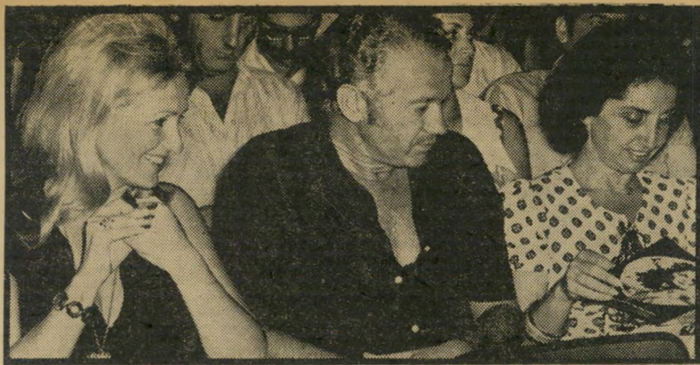
פרופ' מורים לוי גאוות הבולגרים

אני, באופן אישי מתייחסת לסג'נאלוף שמועתי (כן, הוא עלה בדרגה) ברצינות. תגידו מה שתגידו, לא תמיד הוא מתגלה כבלתי-מהימן. לפעמים מסתבר שהוא דור קא משמיע את האמת.