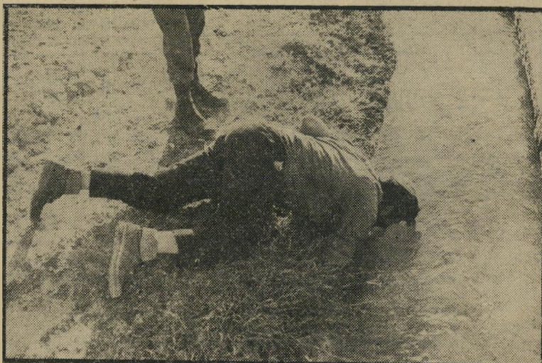
מתנחל שותה ממי תעלת-המים בוואדי קלט לא כדרך הכלבים