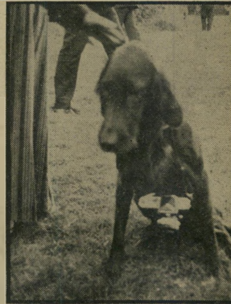
גינג'ר כצלם כך הושג הסקופ

"שידמתם שוחד הצבא כדי שיתן לכם להגיע הנה", בקריאות אלה התקבל צוות העולם הזה שהגיע למרכז ההתנח- לות שנערכה בוואדי קלט. ואומנם, כתב וצלם העולם הזה היו העיר- תונאים היחידים שהצליחו להגיע אל המת- נחלים בוואדי קלט, לעבור את כל מח- סומי הצבא והמשטרה, ולזכות על-ידי כך לאהדת המתנחלים, למרות העובדה שר- עותיו הפוליטיות של העתון אינן עולות בקנה-אחת עם אלה של המתנחלים.