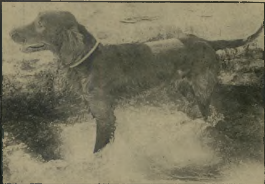
גינג'ר בתעלתי-המים מוואדיקלט כך סערו המים

שהובילה אל המתנחלים. שימחת הפגישה היתה גדולה. המתנח- לים זיהו אותנו, ובעיקר את גינג'ר, מהתנחלות סבסטיה. מזמן כבר לא זכר גינג'ר למנות אוכל כל כך גדולות ול- לטיפות כה רבות, ואנחנו לתמונות כה טובות ולסיפורים בלעדיים.