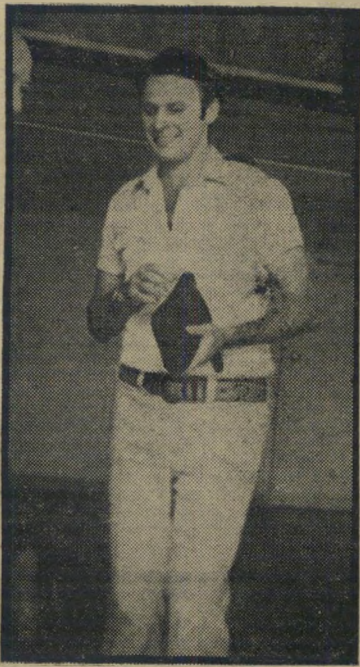
פטורנט נחמנה ברחה גרושה

חודשים אחרי בואו לאיטליה, הסתבר לו כי גם שם לא יוכל ללמוד אך במקום שיחזור לישראל, עלה הצעיר הישראלי על מטוס שהביאו לרומניה, מר לדתו המקורית, שם ביקש ללמוד רפואה שנייה. על כך החליט אחרי התייעצות עם הוריו המתגוררים בישראל, ובהסכמתם של קרוביו תושבי רומניה.