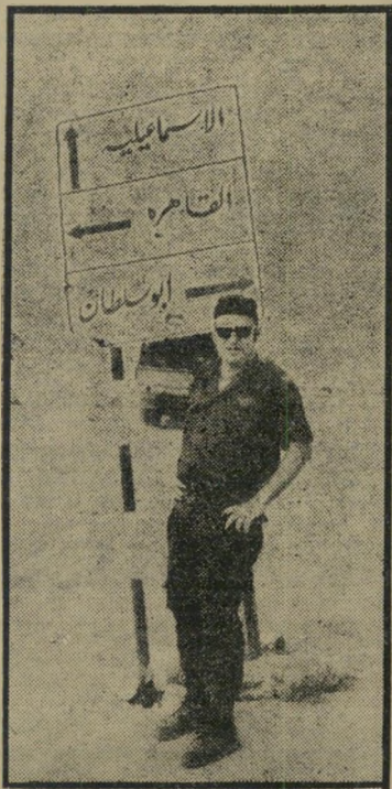
בעי-עיתון שתיל • עור-לעצמו

"אם הכתבה הזו תופיע בעיתונך, אני מבטל את המודעה שאתה מקבל באופן קבוע," הזהיר הפקיד הבכיר של אחד