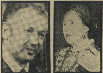
רויבנא יום הולדת דוי מדלייה

הוענק . מדליית-הזיכרון על הישגיו בתחום ניתוחי-הלב והקארדיולוגיה לפרופ' סור מוריס לוי , מבית-החולים בלינסון בפתח-תקווה. את המדלייה, שהוענקה ל-