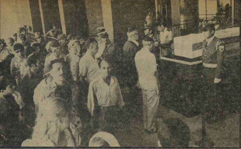
המונים עוברים על פני ארוננו של שזר ההמונים באו

הצטיין בשטח זה עד כדי כך, שלדברי ההלצה ממש המתין להודמנות. אחרוני המייסדים, כשנפטרו, השבוע לווה זלמן שזר על-ידי אהדת הציבור כולו. לא היו לו אויבים. האלפים שעברו על פני ארוננו, בצערי-אמת, באו מכל שכי בות העם, ובעיקר מן הציבור המסורתי. כמו על רבים מבני האבות-המייסדים של המימסד הקיים, אפשר לומר על שזר: אין לו המשך. לא יהיה שזר שני. הוא שייך לדור שהיה בן תקופתו, מוצאו ור מקומו — והוא היה בין אחרוני הדור הזה שהלך לעולמו.