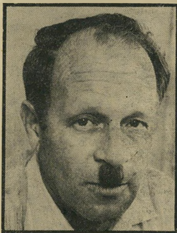
נכה רב עציוני מה יעודד את אנשי היושר?

תודה לכם על הפירסום בעיתונכם הר' מכובד, ותבוא על כולכם הברכה החמה. המשיכו לפרסם את אמיתות הדברים