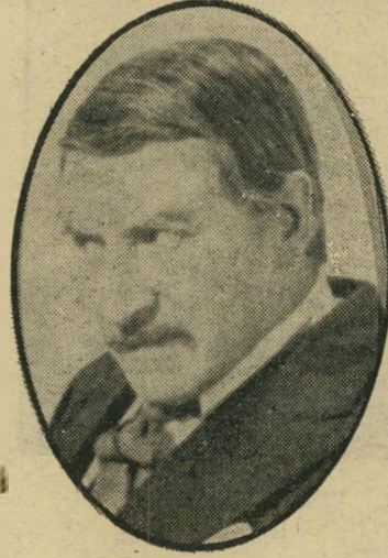
שחקן-מישנה השנה קלייב רביל "אוונטי"

על רב-המכר של הנרי שארייר. ממנו נותר אך מעט על הכד. העיקר היה שסטיב מקווין הופיע בתפקיד הראשי (וגם כשותף שמן בהפקה). וכל המעריצות באו לראות איך הוא סובל בגבורה אבל רוחו אינה נשברת.