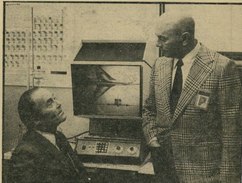
3. הנחש (צרפת)