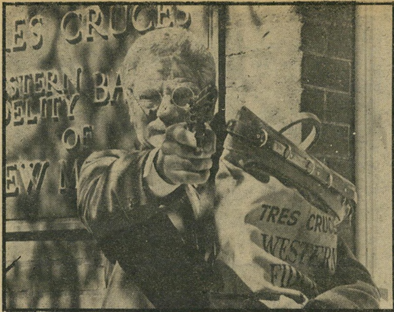
4. צ'ארלי וואריק (ארצות-הברית)