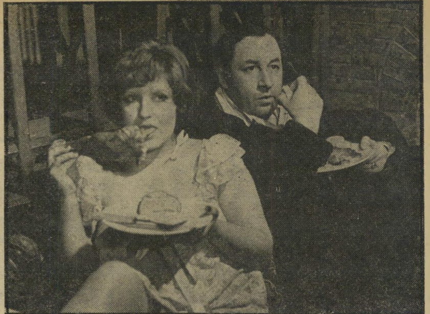
1. הזלילה הגדולה (צרפת)