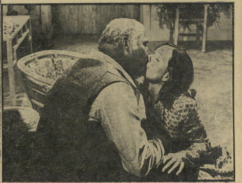
1. האופק האבוד (ארצות-הברית)