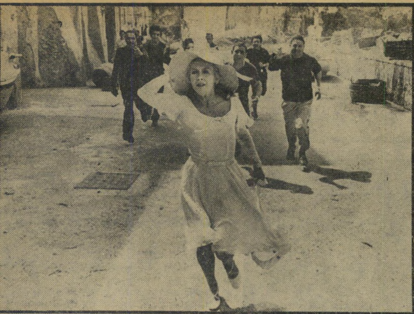
2. אוונטי (ארצות-הברית)