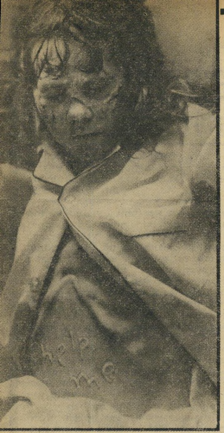
הצילו! אחת התמונות המדעי זעות ביותר בסרט, כחובת הצילו, המופיעה על בסן הילדה.

מחיות-הכפיים שנשמעו עם תום ההקד רנה, וקריאות-ההתרגשות הכפופות של ה-צופים באיתה הקרנה בודדת שנערכה בי שבוע שעבר, יעידו על כך כאלף עדים.