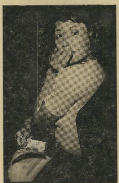
זרה ברכוס המרטיני שלי! קורא הבמאי השיכור בסרט.

ה אמכולנס שניצב על המידרכה, מול הכניסה לקולנוע אסתר בתל-אביב בי יום השישי האחרון, נסע לדרוכו, ללא צופר מרעיש, בתום הקרנת-הבכורה של הסרט מגרש השדים בישראל. אומנם, איש מבין 500 המוזמנים להקד רנה לא התעלף, רק בודדים עזבו את הסרט באמצע משום שלא יכלו לעמוד בזוועה ובפחדים, אולם כשנדלקו שוב הד אורות באולם, היו פניהם של מרבית הד צופים מתוחים וקשים, או מחייכים במי בוכה שכיסתה על המתח. הבמאי, וויליאם פרידקיין, מאיים לעשות לציבור הישראלי, את אשר עשה לציבור צופי-הקולנוע בכל העולם. בסרט מבויים היטב, בעל סצינות קצרות ומעברים חדים, הוא הביא לאופנה העולמית את ההתי פעלות וההערצה למפחד, לגורא ולמבי חיל, כשהוא מותח, בסצינות רבות, את כוח-הסבל ההסתכלותי של הצופה, עד לני-קודת-השבירה שלו כמעט. דרך סצינה של ילדה צעירה המאוננת בעזרת צלב, ועד לתמיהתו של שיכור על שמצא בכוס המרטיני שלו שערית-ערווה בלתי-מוכרת, עורך פרידקיין הסתערות