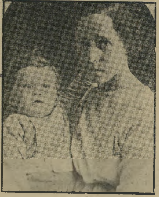
רבין ואמו בתל־אביב