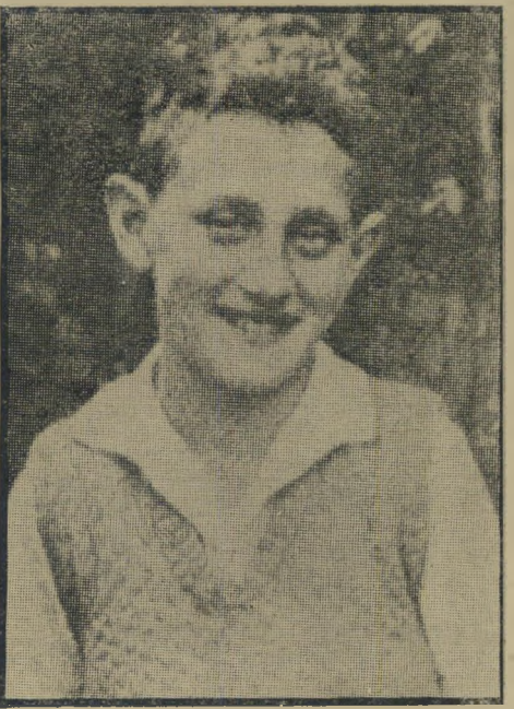
קסינג'ר כנער בגרמניה הנאצית