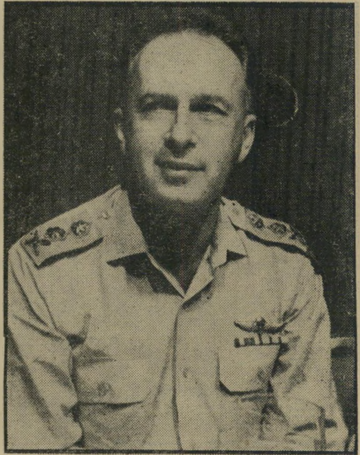
רבין כרמטכ"ל המילחמה, 1967