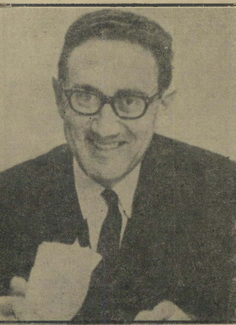
קסינג'ר כפרופסור בהארוארד, 1967