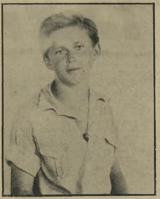
רבין בגבעת־השלושה, 1937