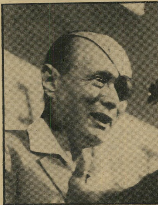
האיש שהופל: דיין מצטדק

המלחמה: "כדי להצליח עכשיו, דרושה רק תכונה אחת: העובדה ששתית ויסקי בווינגטון ביום-הכיפורים."