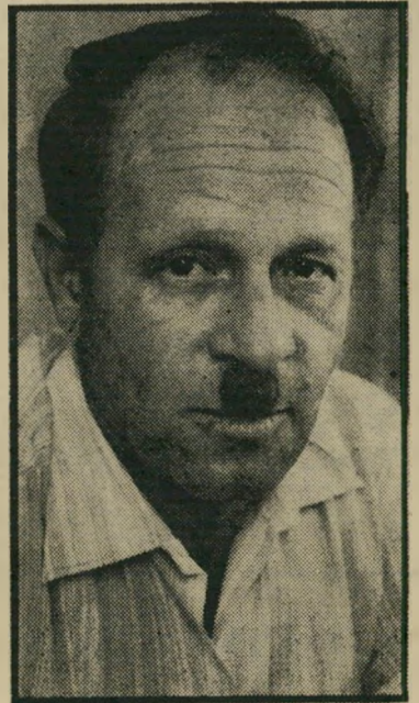
נכחיה"ל עיצוני הרגליים החרמו

אנשי ההוצאה לפועל הגיעו אל ביתו שבצפת, החרימו שם את המכונית שקיבל