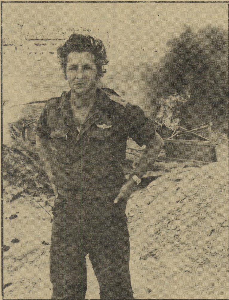
חיידעיתונאיסופר זב מתוך המילחמה

במיקרה כזה, יתגלה לכל כי זנבר רימה את ועדת-ההכספים של הכנסת, שדנה בשער-תו בהטבות שקיבל מן הבנק לפיתוח התעשייה, וחבריה חשבו כי הוא מחוסרי-אמצעים. אילו ידעו אז כי יש לו עוד דירת-סאר אחת בירושלים, ספק אם היו מגינים על מעשי הבנק.