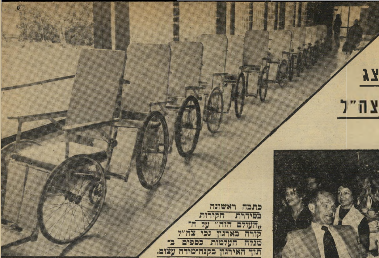
כתבה ראשונה בסדרת הקורות "העולם הזה" על ה' קורה באירגון נכי צה"ל' מגלה העזמות כספים ב' תוך האירגון בקנה-מידה עצום.