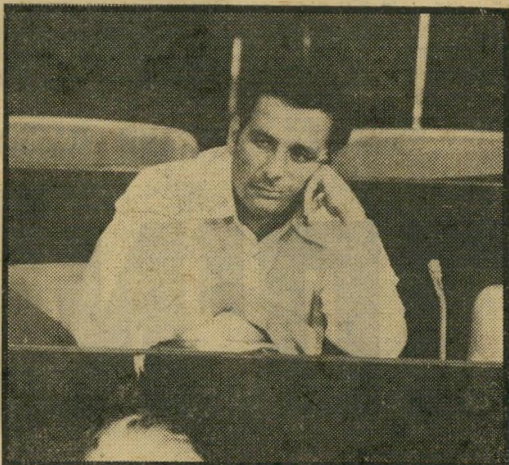
ח"כ בניציון חלפון מה הוא עושה?