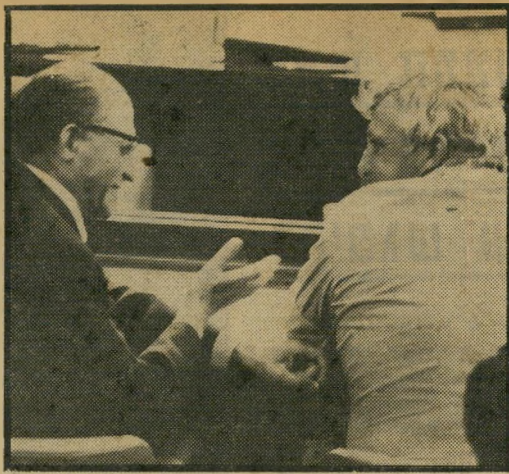
ח"כים אריק שרון ובנין משועמם עד דמעות

המצב בליכוד אינו טוב יותר. אמנם, בחשיבה הליכודית ניכרת פעולתם של קומץ חודשים העולים על הממוצע