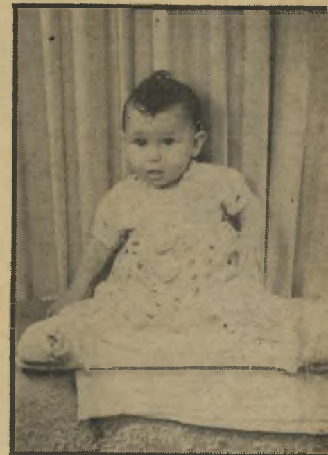
הנכות חיה נולדה כשרגלה האחת קצרה בשיבעה סנטימטרים מן האחרת. כיום היא אלופת-ג'ודו.

ההתנגשות עם האדמה הקשה לא היתה ידודתית כלל. ואחרי שהצליח סוף-סוף לקום על רגליו, גילה הבחור דבר בלתי נעים נוסף: מכנסיו נקרעו מאחור, גילו-