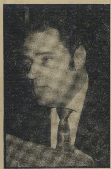
עסקן גריפל מי יתן את הרשיון?

לאחרונה הוצא תיקון לפקודת העיריות וחוק התיכונן והבנייה, לפיו ניתנות סמכו-יות גירחבת לראש העיר, כיושב ראש ועדת בניין העיר; או למהנדס העיר, ל-