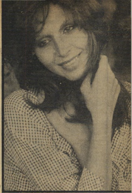
עליזה אדר חייוזורה

אולי אתם עוד לא יודעים, אבל יש לנו כיום אורחת יפה מאוד בארץ. ולא סתם אורחת יפה אלא כוכבת-סרטים, ולא סתם כוכבת-סרטים, אלא כוכבת-סרטים-ישראלית שהגיעה אלינו היישר מאולפני צ'ינה-ציטה שבroma.