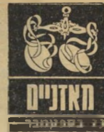
21 בספטמבר - 20 באוקטובר

אם ניחנת בסבלנות, חוש הומור ועצבים חזקים, תהיה זקוק להם מאוד בימים הקרובים. מישוה המקנא בך מסי-בות הידועות רק לשוני-כם, יעשה כמיטב יכול-תו וגם יצליח במידת-מה להפיץ עליך שמו-עות ולהבאישי את רי-חך במקומות חשובים. סיכויים טובים יהיו לך במישור הרומאנטי.