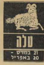
21 במרץ - 20 באפריל

הגל העכור העובר, פעם אחת נוספת, על מחשבותיך עשוי להי' יות מסור עלידי גורם בלתי-צפוי: פגישה עם אדם חדש לגמרי או עם איש מן העבר — אבל מהעבר הרחוק יותר. אל תתני דעתך לצדדים השליליים יו-תר של הסובבים או תן; העריכי את החום האנושי שלהם.