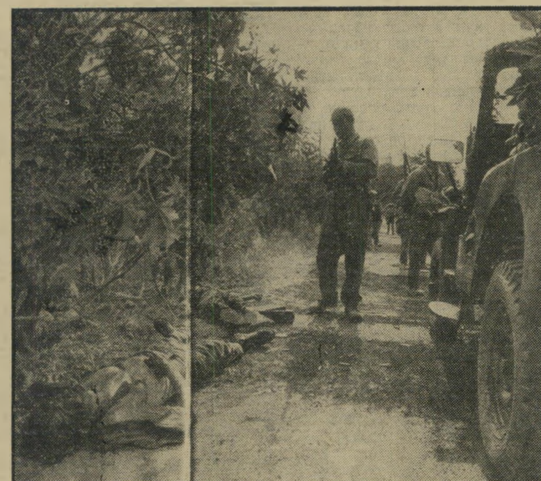
חיילים תורכיים וחללים יוונים בדרך לניקוסיה — בגלל חסידיה

ממבט שיטחי נראה, כי לכל הצדדים תצמח רק טובה מהאיחוד בין שתי ה"י