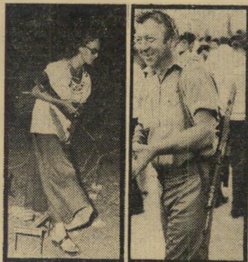
מתנחלים מזויינים כסבסטיה לקחת את הנשק!

אישי לכל המגוייסים, כפי שהוכח במיל-חמת יוסי-הכפורים. מחולק ממחסניו נשק ביד רחבה למפירי-חוק, היא שערורייה וזעקת לשמיים.