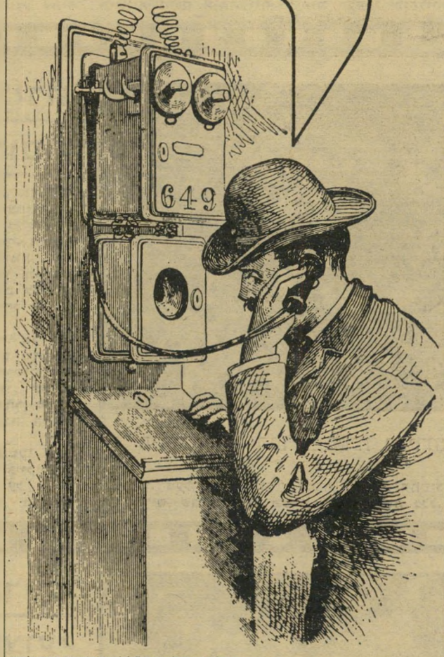
קול-עצוב ביולאומי בע"מ/לשכת הפרסום הממשלתית