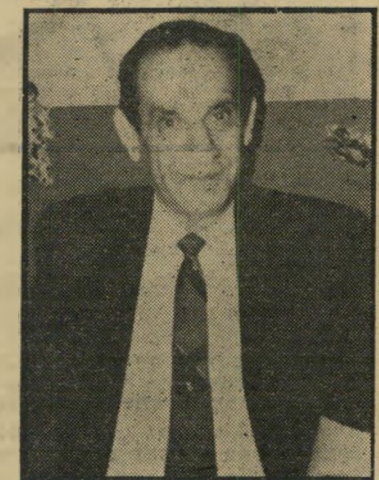
זו בווייאר - לכים הפריץ!

היא לא השקיעה דבר, כיוון ש"שיכון ופיתוח" מימנה ל"מינמטל" את כל ה-20%, באמצעות עסקה מסובכת ב-יתר, גרפו בווייאר-רוטברג שוב, מיליון