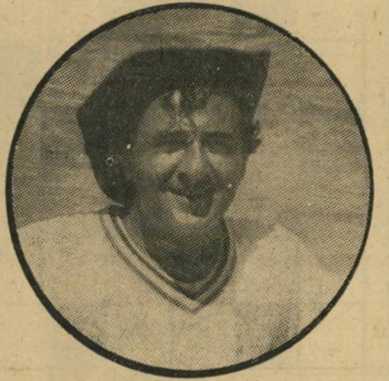
חוגגת כניסירא חגיגה רטובה

אורחי מלון גראנד-ביץ' בתל-אביב, אשר השכימו לטבילת-שחרית בבריכה שעל גג המלון, שיפשו עיניהם בתימהון. הבריכה המלאה מים היתה מלאה גם בדברים נוספים, למשל כיסאות, שול-חנות, בקבוקים ריקים ושיירי-מזון. לפי