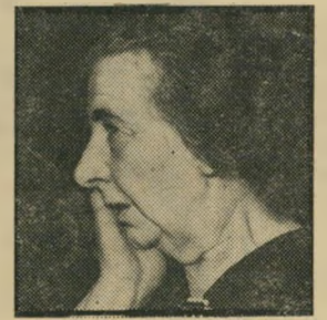
גורדה חצי משכילה

איסר (הראל) דרש מבן גוריון כי יוהיר את דיין מי לדגול בו (בבן-גוריון) במסע ההשמצה שלו נגדי ונגד הי ממשלה, ויצווה עליו להפסיק תעמולת-ידו. (דיין) מוכן להתפשר עם היוזף שביחסים (בינו ובין לבון) ובלבד שיהיה מעליו שרי-ביטחון מוכאש לחי לוחטין בעיני הצבא, ונמצא הוא בלבד עוטר לראשו הילה של כבוד וגבורה, והוא היחיד משני האישים העומדים בראש הצבא (השר והרמטכ"ל) הנעי רץ בשורותיו. זהו על כל פנים, פירושו של איסר. הסיבוכים החלו עם מינון ייו של הרמטכ"ל הקיים (משה דיין). הראה עצמו מדיי נאי. לא הדאגה לביטחון פועלת כאן, בראש וראשונה, אלא יצר הפעלתנות המדינית והביטחון המופרז כי מדיי ניות הרמטכ"ל היא הנכונה.