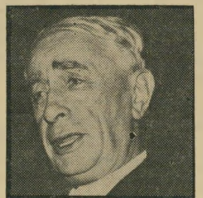
לבון אופי ארוך

משה דיין הוא חייל רק בשעות מיוחדות, אבל בימי