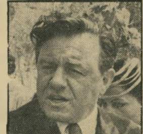
קודק קרואור מבחיקה

נאים פיגורומי ממש... תופעה משונה זו, כיצד אדם כה מוכשר, נבון ולכאורה שקול, מוציא עצמו לתרבות רעה ועובר במהירות מסחררת