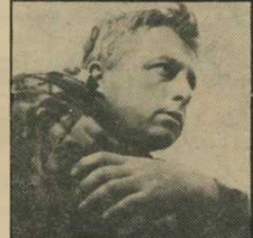
שרון ההסתה הזאת

(אז מנכ"ל משרד האוצר) הוא הכוח היקר ביוי