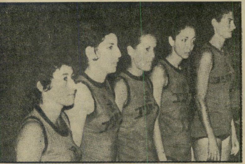
קבוצת הכדורסל של בנות „הפועל“ תל-אביב לפני 4 שנים האלופות שלא היו

תמונה זו של בנות קבוצת הכדורסל של הפועל תל-אביב, התפרסמה בגיליון 98 מחודש יוני, של דיעות הפועל, עיתון לספורט ואינפורמציה, הנשלח לסניפי הפועל בארץ והדפסתו ועריכתו עולים ודאי הרבה כסף. הפיקאנטי בתמונה, המציגה את אלופת המדינה בכדורסל לנשים, הוא