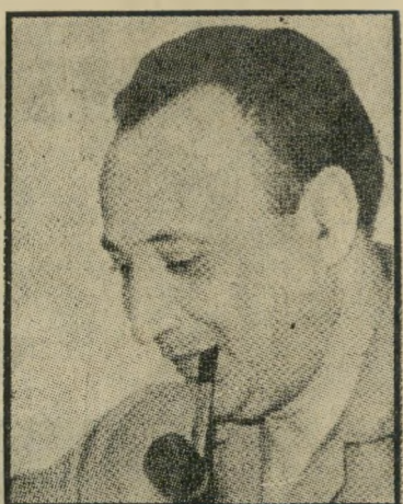
נשיא זמני קפריסין הדוגמה הקפריסאית

איני יודע באיזו מידת אימון זכה אצלך הכיסוי שהעניק העולם הזה בגיליון שעבר לפרשת המהפכה בקפריסין והמשרב הבינלאומי שהתעורר בעקבותיה. כאשר היה אותו גיליון (העולם הזה 1925) בתהליך הכנתו עדיין היה ניקוס סאמפסון, נשיאה החדש של קפריסין, שהדיח את קודמו הנשיא מאקאריוס, הדמות הדומיננ- טית של הפרשה, שהטילה את צילה על כל מה שהתרחש בעיקבות ההתקוממות שהוא