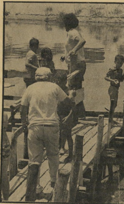
ידיים על הגשר דרכו אל המוות

בזה אחר זה צעדו הילדים לקראת מלכודת המוות. הם פסעו בזהירות על הגשר המורכב משלושה ארבעה קרשים, ב- מצב של התפוררות. צעד קטן ימינה — והמים הירוקים המזוהמים יבלעו את הילד. בזה אחר זה נכנסו לסירות. סצינה זו, שנלקחה כאילו מתוך סרט מתח, מתרחשת דבר יום-ביומו על נחל