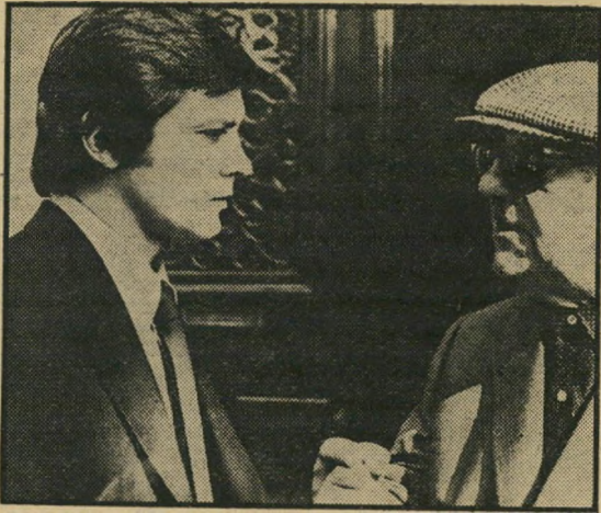
גאבן ודלון: שני המלכים

אלא שג'ון (תיק ירושלים) פלן חסר אותה וירטור אוזיות ההופכת כל סצינה לחווייה בפני עצמה, וכל סוף-סצינה לתפנית עוצרת-נשימה. תחת זאת, הוא מנסה להתייחס אל הסיפור שלו במציאותיות, אך מאחר ש-