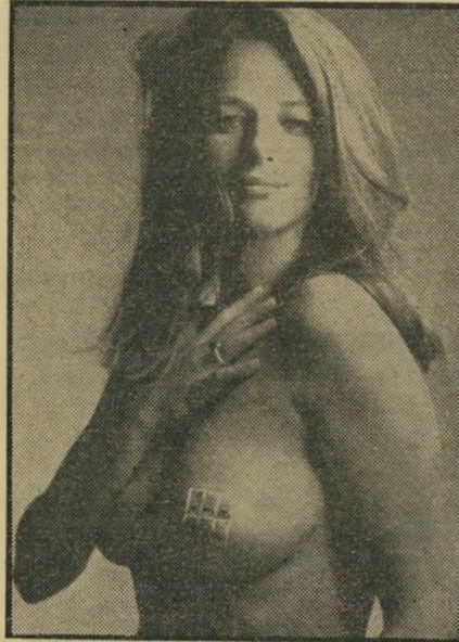
ראמפלינג כרוגמנית היהודיה נאנסה במחנהריכוז -

*** עיניים גדולות (סטודיו, ישר"א): סירטו הטוב והבוגר ביותר של אורי זוהר, המגביר את האמונה שזוהר הכישרון הקולנועי היחידי האמיתי הקיים בישראל. סיפור על מאמן קבוצת כדורסל המשתוקק להשיג את כל הגעים, הטוב וימשתלם בעולם, ומסרב לשלם עבורם ב-