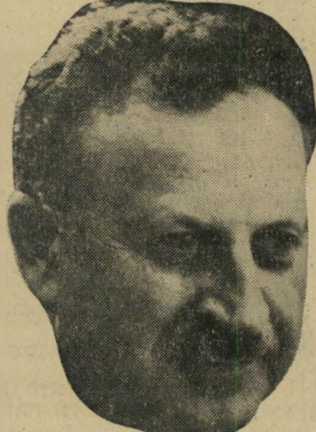
מרידור כספים קפואים

על מידת הריווחיות מהובלות נפט ני-תן ללמוד מן התוצאות העיסוקיות של קו צינוור אילת-אשקלון. הקו, בניחולו