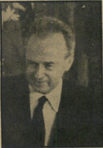
רבין והעניבות העקומות איד להתלבש?