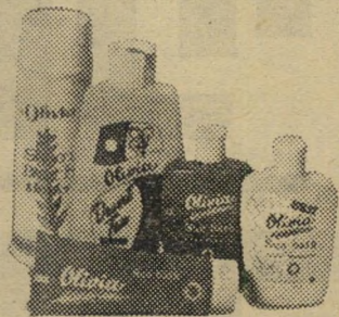
פרסום פלד משה עמר נורברט