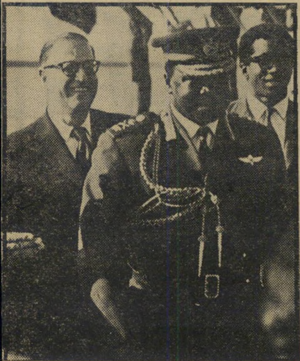
אמין, "דאדא" ואבן כן נכבשה רמת הגולן

רעל לקופה. ההשקפה הפושטת בין מפיצי-סרטים בארץ היא, שתעודה בקולנוע