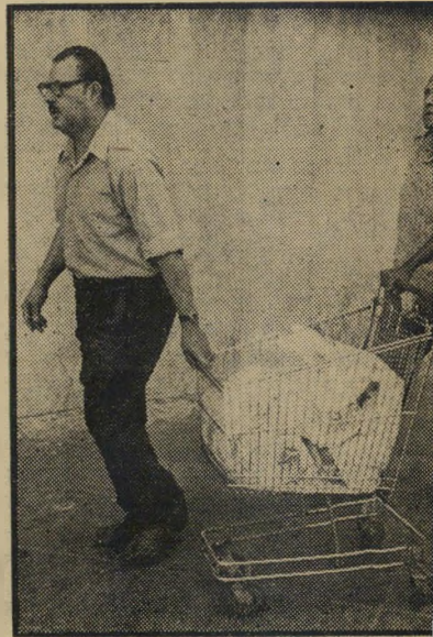
הכסף בדרך הזמנה לשדד

נא להתבונן היטב בתמונה. בעגלה זו אין ירקות או פירות. יש בה כסף. מאות אלפי לירות, המובלות כך עלידי מוס-דוּת רבים מ"בנק ישראל" בתל-אביב. הבנק מוביל את הכסף בצורה כזו כדי לחסוך 50 לירות, דמי-ההובלה במכונית משורינית. כאשר יישדד הכסף, הביטוח ישלם. לכן למי זה איכפת?