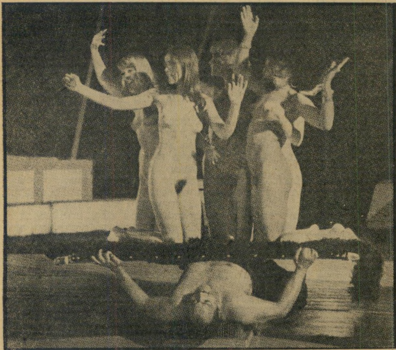
קולנויות ב"הצגה הזוהרת ביותר" לשחרר ממעצורים

סירטם החדש של קרונהאוזנים ישאיר בוודאי את צופיו נטולי מעצורים לחלוטין. פרט לכך, הוא גם יעזור במידה ניכרת לכלכלת המישפחה. בפסטיבל קאן, שם הוצג במיסגרת השוק, נגנבו גלגלי הסרט בשעה שהוקרן. כלומר, אפילו הגנבים ידעו שזהו רכוש בעל-ערך. ואין בכך פלא, אם זוכרים ששם סיפרו