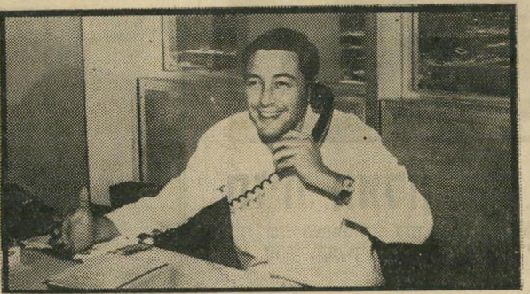
יוסף ריזי התאונה בישרה

מי זוכר היום את ג'וזי ואת ביאטריס שוורץ? אמצו את הזיכרון, לא נורא, זה דווקא בריא. כן, זהו. בדיוק כך. את שני השמות הללו היינו פוגשים שוב ושוב, בכל פעם שאיזה זמר ידוע, ישראלי שהצליח בחו"ל או כל אחד אחר, היה מגיע ארצה, כדוגמת בייק בראנט או אבי עופרים, למשל.