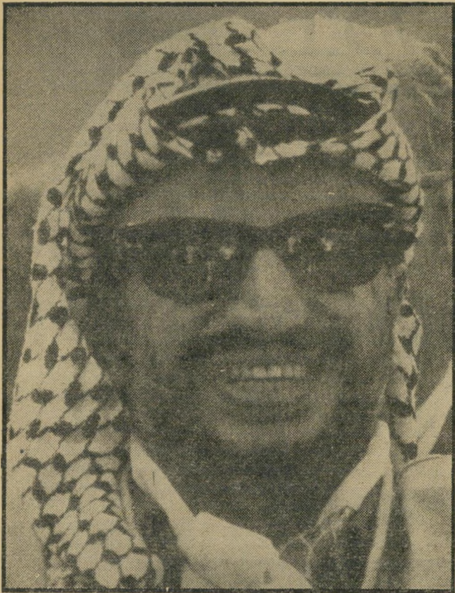
יאסיר עראפאת לא עוד: הכל או לא כלום

המדינה כרוכה, על-כן, בכריתת שלום רישמי עם ישראל ובהכרה זו.