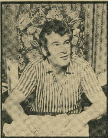
בעריכספת פסחוביץ מה יש בפנים?

חייב להמר: האם הספק פסחוביץ לה-ריק אותה, או שמא היא מכילה, אולי, יהלומים ודולרים בכמה מיליונים טו-ביס?