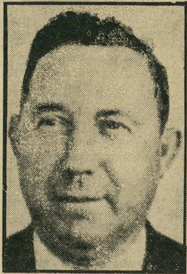
מ"מ הרק לא בטוח