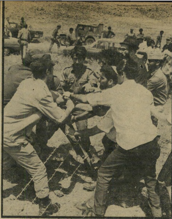
חיילי צה"ל מסדקים את הגדר (מימין) ואת המתנחלים (משמאל)