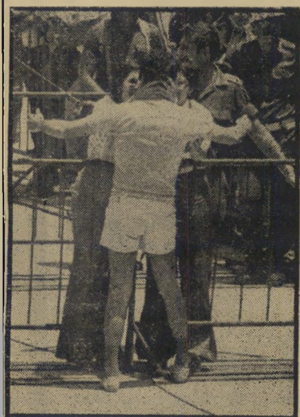
— ומחבק את חברתו — פרס'נובל שני?

"כמה זמן?" שאלו מאות אלפי ישראלים השבוע. חלק מהם התכוונו לאורך תקופת כהונתה של ממשלת יצחק רבין. האחרים התכוונו לאורך תקופת הפסקת-האש. ש