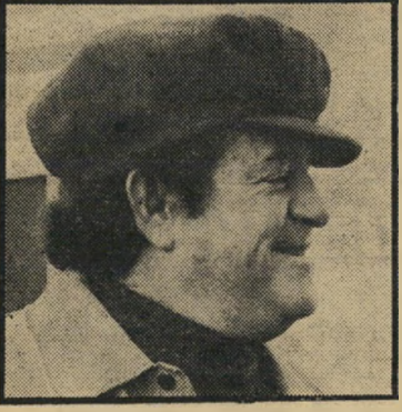
מפיק גולן הצלחה לטרט