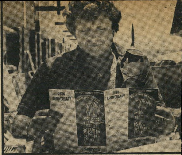
אמרגן דישי — האופציות