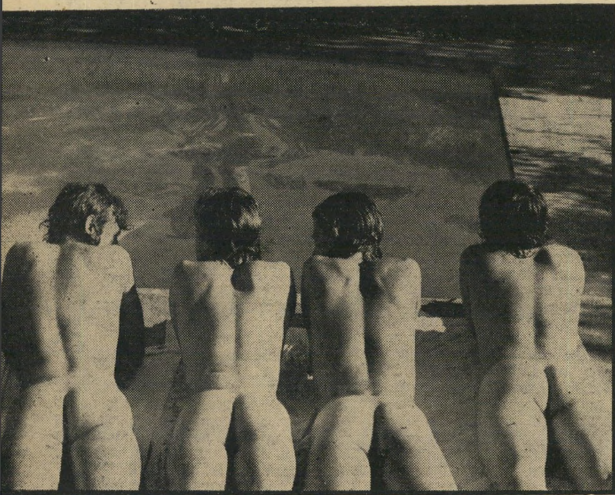
חיי ההומואים פרקים מתוך חייו הסוערים של הצייר ההומוסקסואלי האופנתי, דיוויד הוקניי, ועל השפעתם של חייו אלה על יצירתו. תמונה זו, הופכת בצילומי הסרט הכתם הגדול, מחוויה חיה לציור נע.

אלא שאלה היו כאין וכאפס למול סרטים פוליטיים מפורשים בהחלט, כמו פרקים מתולדותיה של שיפחה, סרט גרמני ש' הוקדש כולו, בצורה קיצונית ובלתי מאוזנת, לקיפוח החברתי של האשה המחפשת זהות עצמית. או לכל האחרים קוראים עלי, סרט גרמני נוסף, שזכה בפרס הבי' קורת, המתאר את גורלם של פועלים ער' ביים בגרמניה, תוך תיאור נישואיו של סעל כוה, גבר במיטב-שנותיו, לאשה גר'