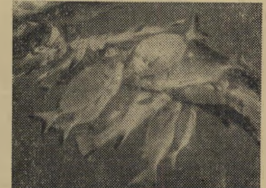
הפרלמנט המקומי בשעת דיון בענייני חוץ וביטחון

מייעצה, השולטת באי מזה אלף שנה, מורכבת מאצות ואגוזי-קוס. עורכת העיתון המקומי היא תולעת-משי אוכלת דקלים וכל עיסוקיה מצטמצמים בכתיבת טור רכילות שבועי העוסק בעיקר ברבייתם של דגי הטונה (או על איזה