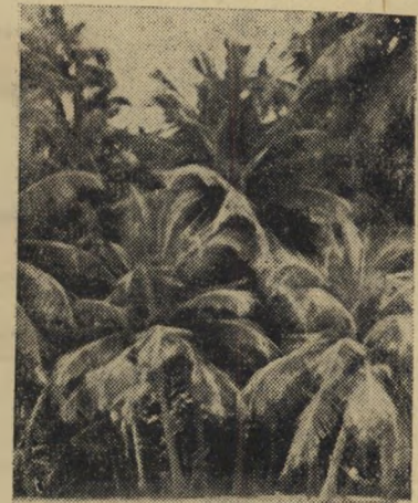
כד הארץ דקלים דקלים אין שיכונים לזוגות צעירים

באבולו אין ילדים. אין גם פלשתינאים. באבולו כולם זגים, או זכרות, או דובי-קרח לבנים, או גמלים. המועצה הי-