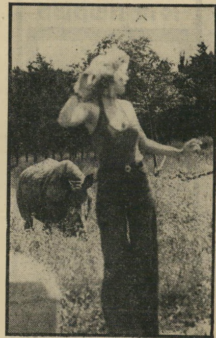
— זהו מיסתער עזיה בשר

לאמנון יש אלרגיה לקהל, מהסוג הרמסוים. "יש אנשים," הוא מספר, "שחושבים שכאן זה גן-חיות. הם באים, זורקים בקבוקים על החיות, מנסים להתעלל בהן. לא איכפת לי הסכנה שושקפת לאותם אנשים, בעיקר לאלה שרוצים להשוויץ