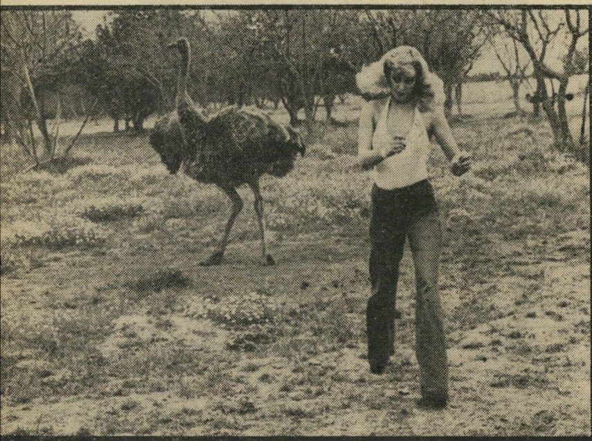
פנינה בורחת מפני היען המסוכן להרוג במכה

ויורדים מהמכוניות, איכפת לי רק מן החיות עצמן." אמנון יודע לספר על נהג סנדר אשר ניסה לדרוס, כבדיחה, את אחד האריות. האריה התרגז, התנפל על צמיגי הסנדר ואכל שניים מהם. נהג הסנדר האמיץ נאלץ לבלות ארבע שעות תמימות, ביום חמ"סין לוהט, בתוך הסנדר בעל החלונות הסגורים, עד שבאו לחלץ אותו. "יכולנו לחלץ אותו מייד," סיפר אמנון, אבל החלטנו להעניש אותו ולתת להיצלות שם כמה שעות."