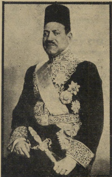
מוצטפה אינחאם סאדאת לא טלח

יתכן שהמחדל הנורא של יום-הכיפורים היה נמנע, אילו שלטו בישראל אנשים שהיו מצויים יותר במניעי המצרים וב"תולדותיהם. אבל בשביל גולדה, אלה הם דברים מגוחכים. על כן התפארה השבוע בפני הפועלות: "גם אני לא ידעתי."