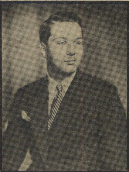
המנכ"ל פארוק (1940) גולדה לא ידעה

קרב למרכז מצריים, החלו הבריטים דואר גים לעורף צבאם. הם הציגו למלך פארוק אולטימטום גס: למסור את השילטון בידי אדם המקובל על הבריטים, מוצטפה נחאס באשה* ולא — יסולק פארוק מכיסאו ויוגלה לדרום-אפריקה. לחיזוק התביעה, הוקף הארמון בטאנקים בריטיים, לעיני העם המצרי כולו. עד לאותו זמן היה פארוק מלך צעיר, יפה-תואר ומקובל על הבריות. הוא רכש את אהדת עמו כאשר עלה לשילטון, ור פטר מייד את שרי אביו, המלך פואד. אולם תחת הלחץ, התמוטט פארוק, הוא נכנע לאולטימטום. באותו רגע איבד את עולמו. הוא נשבר אישית, ומאז החל משמין ומירדרר. הגוער המצרי, ובראשו קציני-הצבא הצעירים, מאסו בו והיפשו דרך החזיר לעצמם את הכבוד הלאומי.